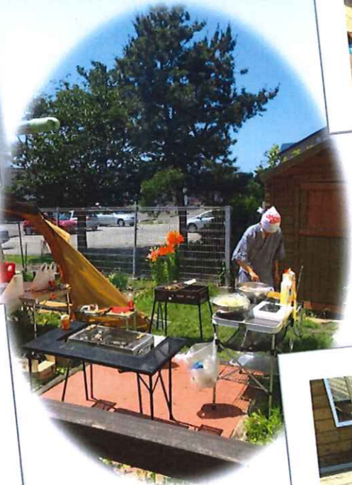
たまたま 外で食事は 良いわ♡