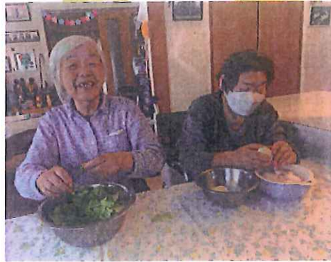
レタスを ちぎる 卵の 殻むき