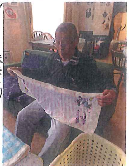
決めた物を 作らね