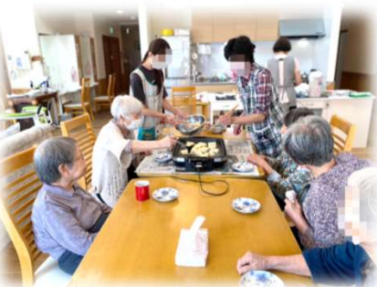
フレンチトースト