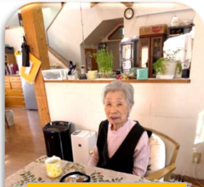
新しい服で 過ごしてます