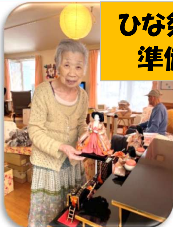
ひな祭りの 準備中