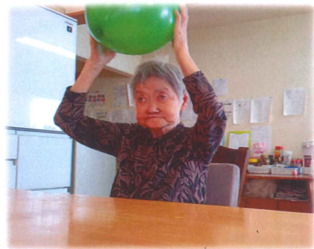
三狙いを定めて三