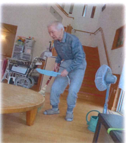
いつも床ピカピカです!