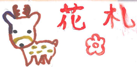
カルタ取り 真剣です