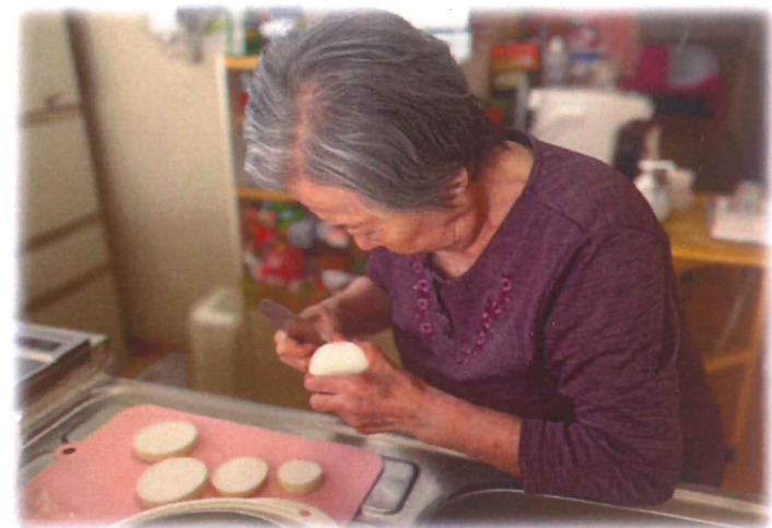
人参にじゃが芋... カレーかな??