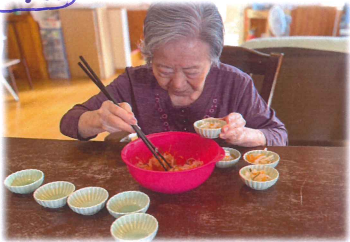
皆さんで盛りつけ